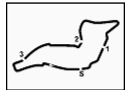
Enzo e Dino Ferrari 4.909 m